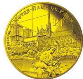
200ユーロ金貨〈ノートルダム大聖堂〉