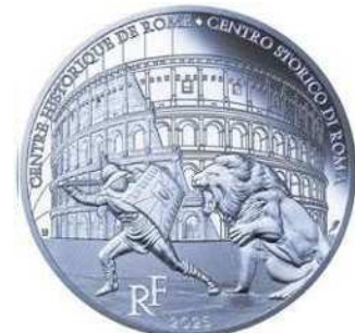
10ユーロ銀貨〈コロッセオ〉