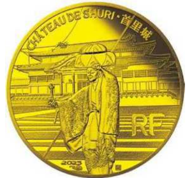
500ユーロ金貨〈首里城〉