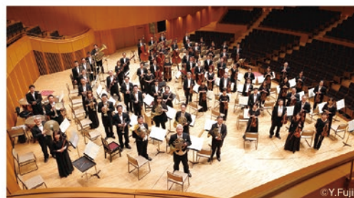
管弦楽 札幌交響楽団