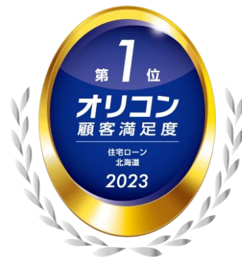
2023年 オリコン顧客満足度(R)調査 住宅ローン 北海道 第1位